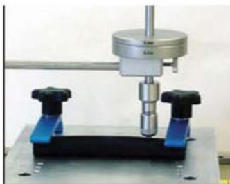
图示：加厚物件的磨耗测试